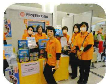
全国大会物産展出展