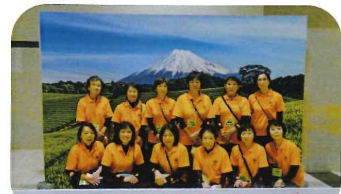
第24回 商工会女性部全国大会 in しずおか