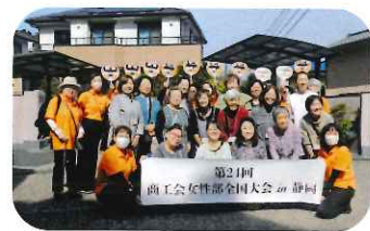
神奈川県連の皆様

全国から女性部約2000名が集結した静岡大会は、大成功を収めた。おもてなしの心が静岡県全域から寄せられ、お客様に届いた賜物だと思う。伊豆の国市の部員の働きも見事で、広域に渡るつながりは、今後の活動の糧となるにちがいない。（T.H）